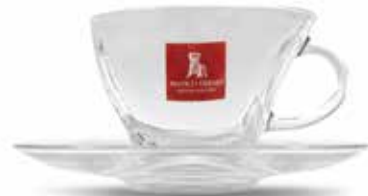
Tazza grande con piattino per hot drink