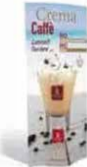
Totem bifacciale 80x150