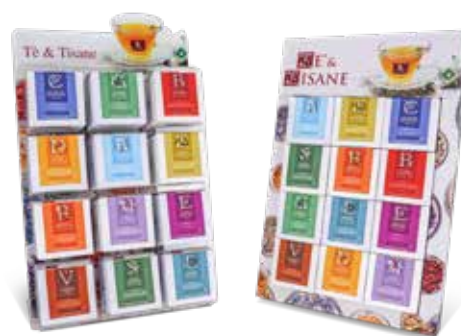
Kit espositore 12 gusti cartonato e espositore plexiglass