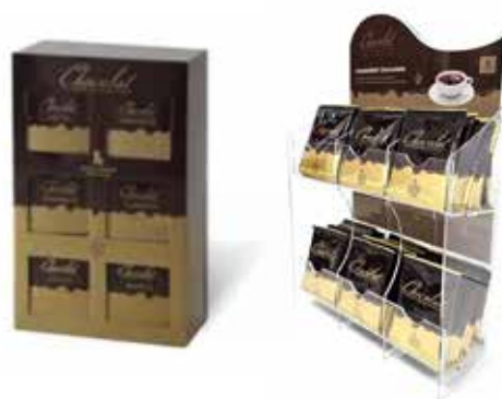
Kit espositore 6 gusti e espositore plexiglass