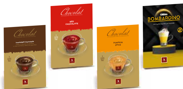
Cartello da banco 20x30