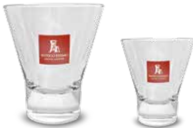
Bicchieri ypsilon grande Bicchieri ypsilon piccolo