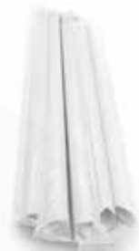
Cartello da banco 20x30 Cannuccia Bio