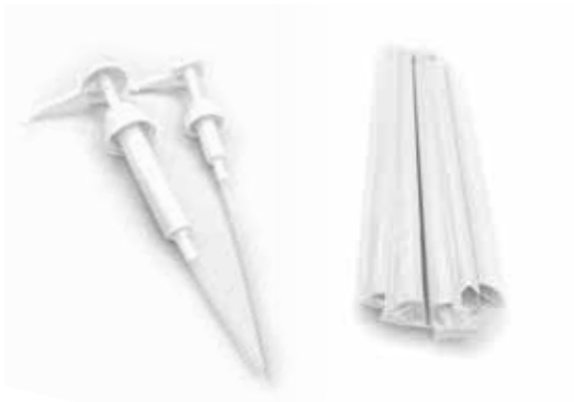
Pompetta dosatrice insaporitore / scioppo Cannuccia Bio