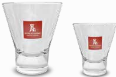
Bicchiere ypsilon grande Bicchiere ypsilon piccolo