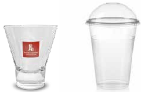
Bicchiere ypsilon grande Bicchiere da asporto 500 mL con cupola