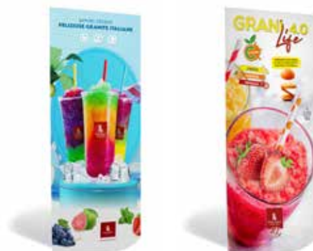
Totem bifacciale 80x150