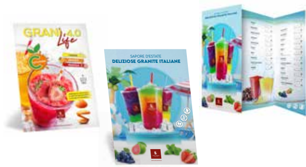
Cartello da banco 20x30 Pieghevole