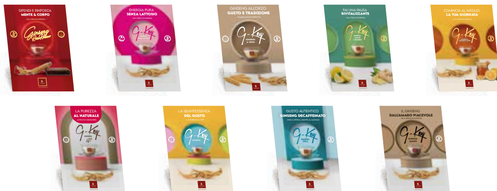
Cartello da banco 20x30