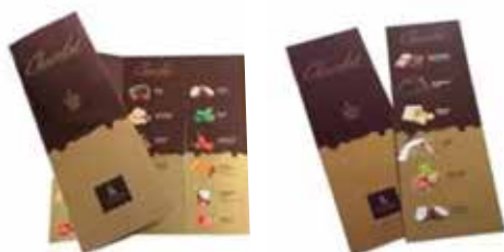
Pieghevole 3 ante / 2 ante