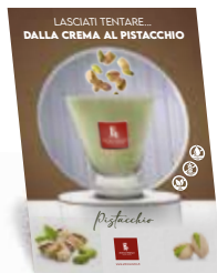
Cartello da banco 20x30