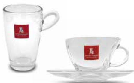
Tazza mug Tazza grande con piattino per hot drink