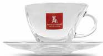
Tazza con piattino per bevande calde