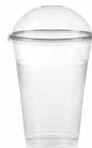
Bicchieri da asporto 500 mL con cupola